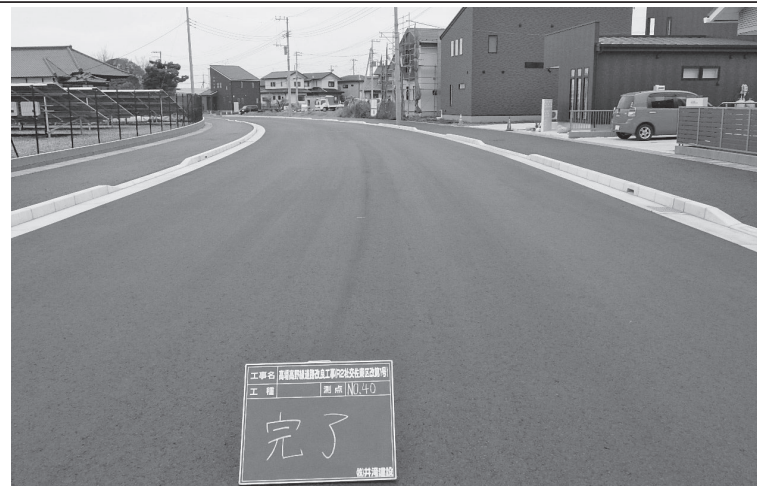
〔21年度完成工事5件〕 高場高野線道路改良工事(R2社交佐東区改第1号)