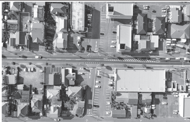
〔21年度完成工事4件〕 舗装補修工事(R3道管補修第7号)