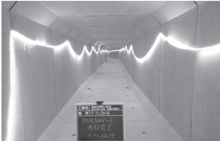
〔21年度完成工事4件〕 高場雨水2号幹線管きよ布設工事(R2国補下第1号)