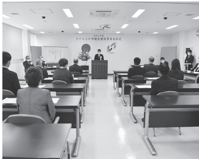
感染症対策を十分に行い開催された