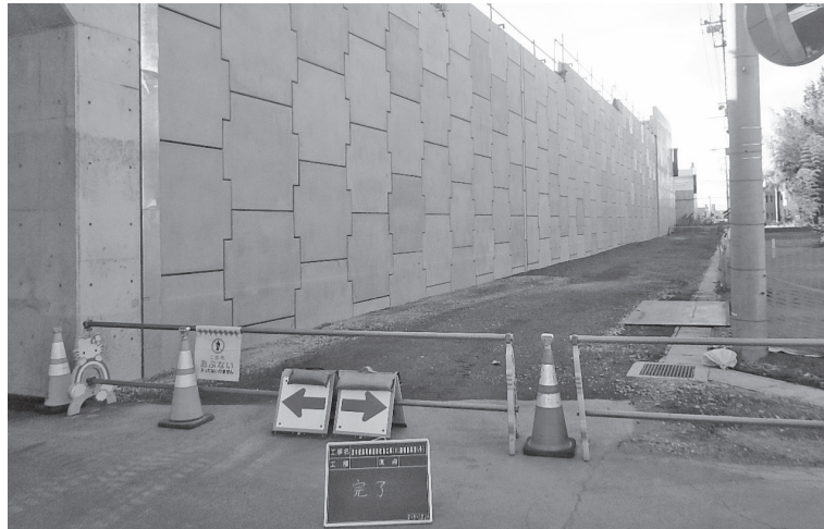
〔21年度完成工事7件〕 東中根高場線道路改良工事(R2国補都再第4号)