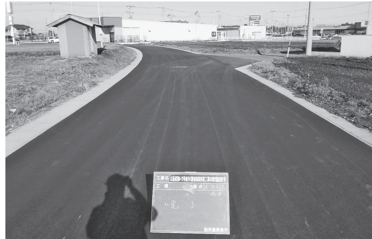
〔21年度完成工事9件〕 区画道路672号線外2路線舗装新設工事(R3東2舗装第2号)