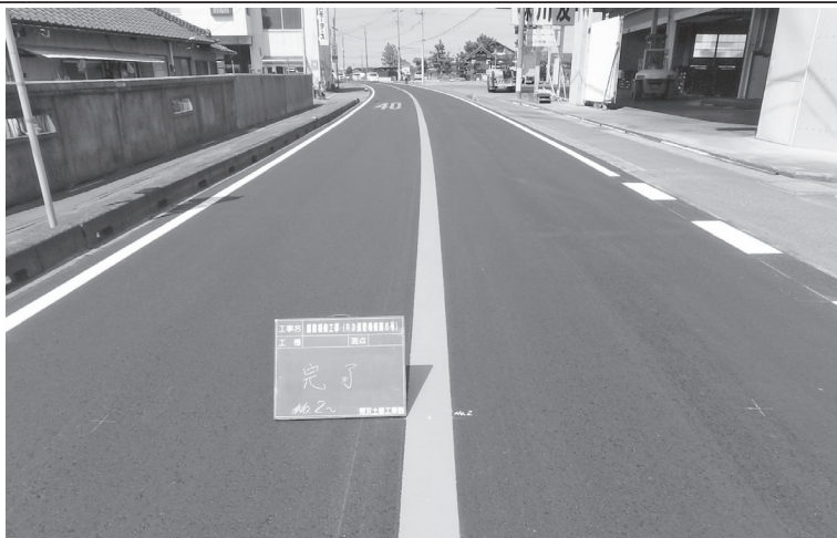
〔21年度完成工事4件〕 舗装補修工事(R3道管補修第5号)