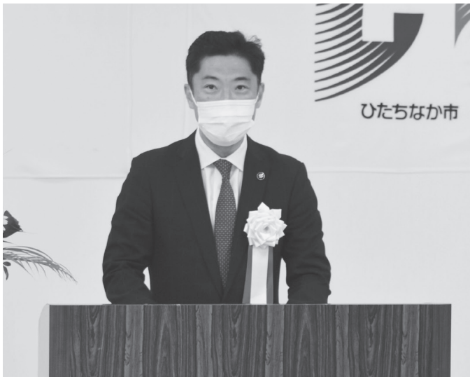
大谷市長が感謝とお祝いを述べた