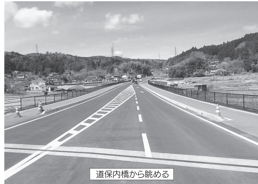
道保内橋から眺める