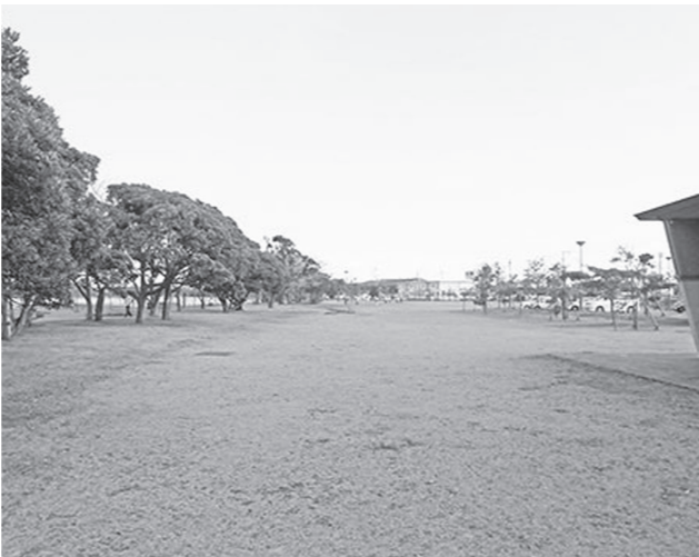
カフェを設置する神之池緑地

完了する予定です。そのほか3・4・21号線を行い基準点を確定させました。現在線の整備も行っており、21年度は神栖2丁目から3丁目地内の約700m区間で再測