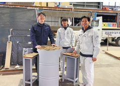
技術者が輝く職場づくり