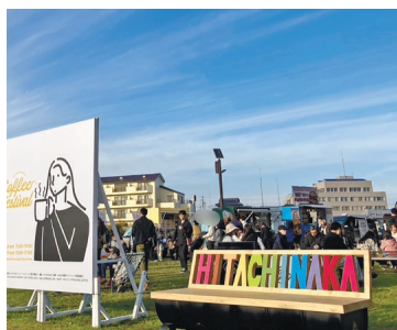
什器は地域イベントでも広く活用

グロビオななか」や「ひたちなかグリーンフェスティバル」などの地域イベントに設置・協力を行っている。このほか「クリスマスマーケット」ひたちなか(12月19日)、舞水性中公園(1月25日)文化会館(1月25日)の設置を定めており、活動の幅を県内全域へ広げている。