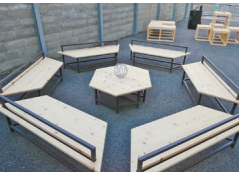
ヘキサゴンベンチ