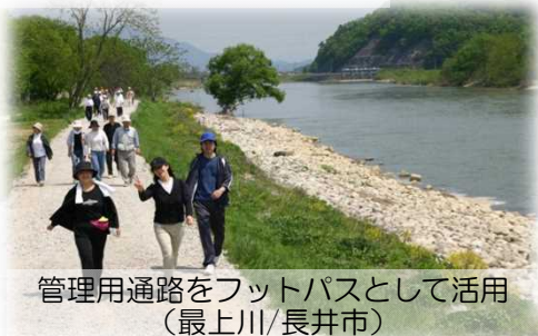
管理用通路をフットパスとして活用 (最上川/長井市)