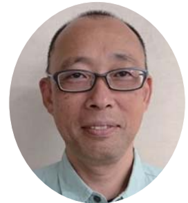
現場代理人・監理技術者