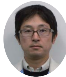
ハシバテクノス(株) 監理技術者兼現場代理人