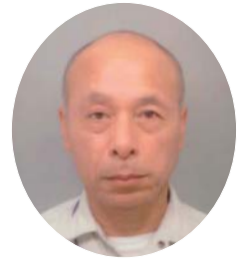
(株)武井組 主任技術者