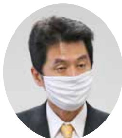
式辞を述べる岡村局長

国土交通省北陸地方整備局（岡村次郎局長）は9月14日、2020年度安全管理優良受注者表彰式を挙行政した。19年度に完成した工事受注者337者の中から選定された19者が表彰され、県内からは相模組と傳刀組（ともに大田市）が荣誉に浴した。