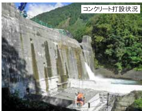
コンクリート打設状況